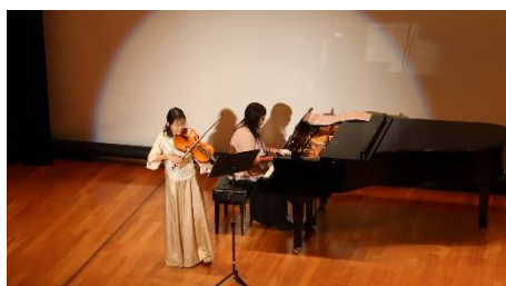
ビオラ&ピアノ 演奏