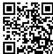
(スマホ用 QR コード)