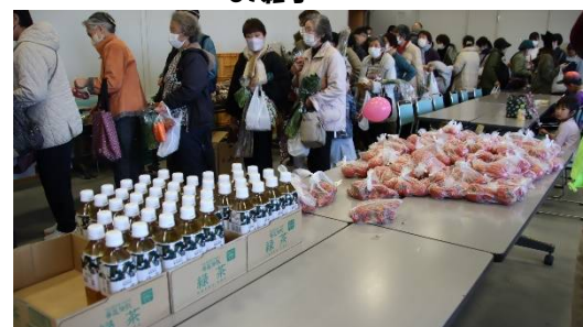
大行列の野菜即売会